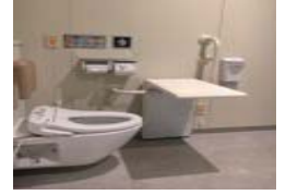
前傾姿勢支持テーブル型すすりFUNレストテーブル

専門は『地域ケア論』と『ケースマネジメント』、『遊びリテーション』の第一人者としても有名。人間生理学に基づいた、介護の新しい考え方と助産技術、さらにそれらを具現化する新発想の機器(FUNシリーズ)と、空間づくり(設計監修)を提案・実現するために、介護総合研究所『元気の素』を設立し代表を務める。主な活動は、全国を講演・現場指導、人間工学に基づいた生活用品の発案、そして介護施設の開設準備にともなう「ひともの・はこ」の総合プロデュースや、施設などの新築・改築の設計・施工の監修及び、コンサルタント等と幅広い。コンサルティング事業の一環である「経営指導」も、独自の理論で“役所的”と言われている介護界に費用対効果をもたらしており、また人材育成では介護技術のみならず、組織リーダー論は元より、自らの“ストイックな仕事理論”である「カッコいい大人論!」も取り入れ、個人・組織のレベルアップをはかり好評を得ている。著書に「遊び井」(Bricolage)、「新しい痴呆ケア」「介護リーダーの条件」(雲母書房)、「お風呂が生活をえていく」「新しい排泄介護の技術」(中央法規出版)などがあ